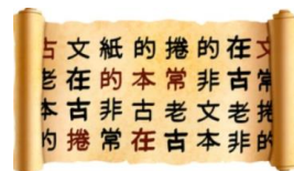
Mynd 2.1: Papyrus

Orðið „pappír“ er talið runnið frá egypska orðinu papyrus, en Forn-Egyptar fóru að nota stöngla Papýrus-jurtarinnar ( Cyperus papyrus ) til að búa til arkir til að skrifa á strax um 3000 árum fyrir Kristsburð. Grikkir, og síðar Rómverjar, lærðu að búa til slíkar arkir af Egyptum. Pappír 2 er að mestu leyti búinn til úr jurtaefnum, venjulega úr viði en oft er einnig notað annað efni eins og bómull, hör, hampur og lín. Pappír er mest notaður til að skrifa, teikna og prenta á en einnig er hann notaður til að pakka inn hlutum og jafnvel í matargerð. Byrjað er á því að höggva tré. Síðan er börkurinn fjarlægður af stofninum. Stofninn er síðan bútaður niður. Bútarinn eru svo settir í stóran strokk sem gerir þá að mauki. Maukið er síðan sett í aðra vél sem hnoðar maukið. Síðan er það þurrkað og pressað og straujað og sett á stórar rúllur.