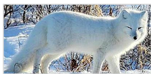
Mynd 1.1: Heimskautarefur

Heimskautarefur eða fjallarefur, einnig nefndur tófa eða refur á íslensku, er tegund refa af ættkvísl refa sem tilheyrir hundaætt. Heimskautarefurinn er eina landspendýrið í íslensku dýraríki, sem hefur borist til Íslands án aðstoðar manna. Tófur má finna um allar Norðurslóðir. Tegundin er í útrýmingarhættu í Noregi, Svíþjóð og Finnlandi og á eyjum við austur Síberíu. Heimskautarefurinn lifir á eyjum og meginlöndum allt í kringum Norðurslóðir. Á tveimur svæðum er