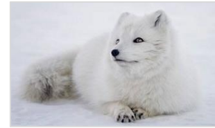
Mynd 2.1: Hvít tófa í vetrarbúningi

Tófan er einstaklega vel hæf til að lifa í heimskaualoftslagi og hefur mjög þéttan feld sem einangrar hana vel, jafnvel í miklum kulda. Um 70% af feldinum er undirhár sem gerir það mögulegt að halda eðlilegum líkamshita þó umhverfið fari allt niður í 35°C frost. Tófan hefur mjög stutt skott, trýni, háls og lítil eyru miðað við aðrar refategundir og hefur þróast þannig til að takmarka hitatap. Tófan er aðallega á ferðinni að degi til, ekki síst í ljósaskiptum kvölds og morgna. Tvö meginlitarafbrigði eru af tófu, hvít dýr og mórauð. Mórauðu tófunar eru dökkbrúnar allt árið um kring. Á Íslandi eru um 70% dýranna mórauð en á heildina litið er hvíta litarafbrigðið í miklum meirihluta. Mórauðir refir eru einkum á eyjum og við strendur, en á meginlandi Síberíu og stærstum hluta heimskautasvæðis Kanada eru hvítir refir um 90% af stofninum.